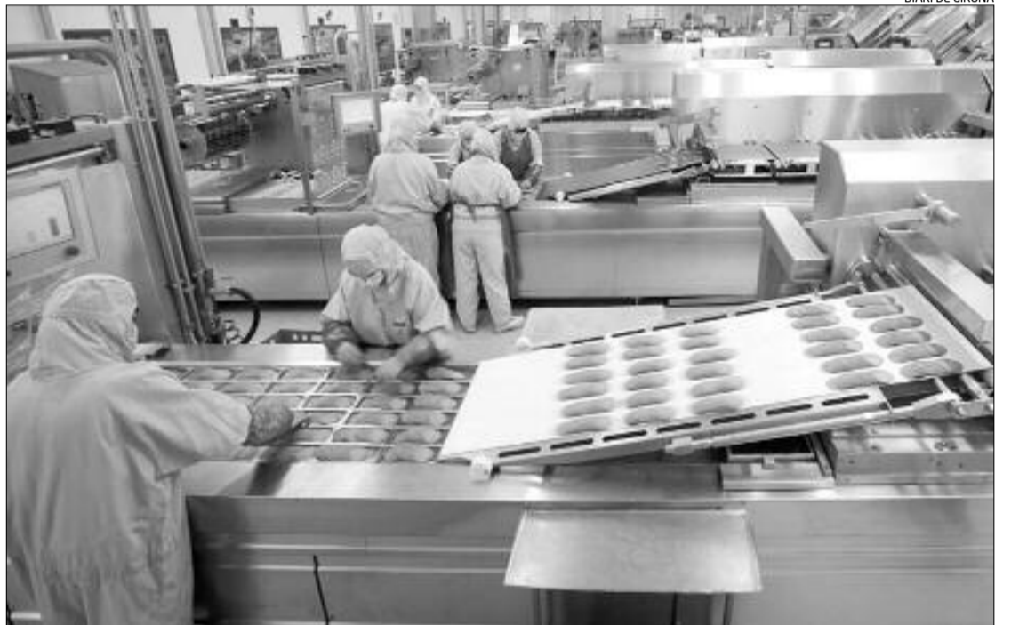
Instal·lacions d'Embotits Monter, un dels proveïdors gironins de Mercadona

Segons va informar la companyia valenciana en un comunicat, en el marc de vincular part de la seva retribució als beneficis i a la productivitat de la companyia, Mercadona ha repartit entre els seus treballadors 240 milions d'euros en concepte de primes per objectius.